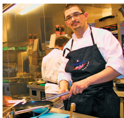
Mehr Transparenz: Hygieneportale sollen auch für saubere Küchen sorgen

Doch das auf einem Minuspunktesystem von 0 bis 80 basierende Bewertungssystem weist gravierende Mängel wie technische Pannen und Fehleinschätzungen auf. So stand eine Bar in Lichtenberg mit 47 Minuspunkten eine Woche im Netz, ohne dass überhaupt eine Kontrolle stattgefunden hatte. Ein Restaurant im Prenzlauer Berg hatte im Juli wegen baulicher Mängel ebenfalls ein „nicht ausreichend“ bekommen. Laut Mitarbeiteraussagen standen aber